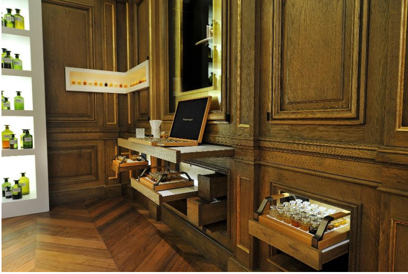
Deux présentoirs d'angle en Corian avec illumination des flacons par-dessous au travers du Corian.