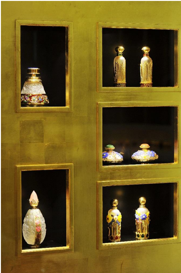
Deux grandes vitrines de présentation avec niches et podium laqué noir et face et moulures dorées à la feuille.