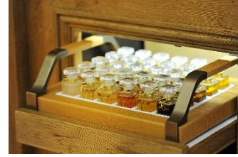
Plateau de présentation en cuir et Corian avec poignées en bronze.